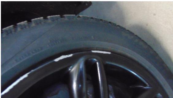
Abbildung 3: siehe pos.3