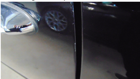
Abbildung 9: siehe pos.9