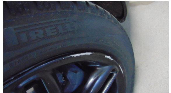
Abbildung 2: siehe pos.2