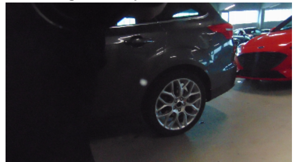
Abbildung 8: siehe pos.8