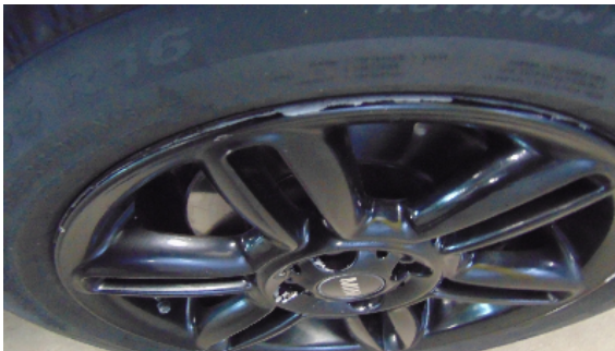
Abbildung 1: siehe pos.1