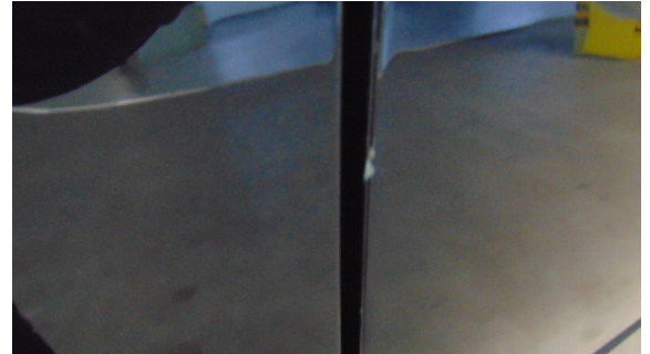
Abbildung 6: siehe pos.6