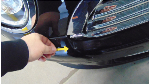
Abbildung 5: siehe pos.5