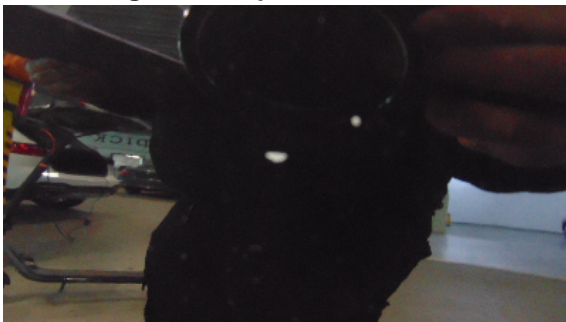
Abbildung 7: siehe pos.7