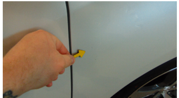
Abbildung 6: siehe pos.6