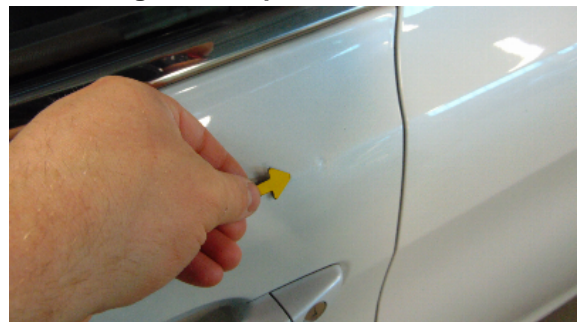
Abbildung 8: siehe pos.8