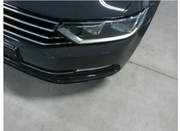
Abbildung 4: Siehe Pos.3