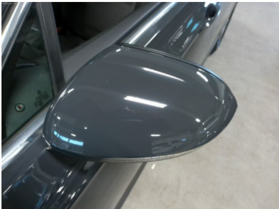
Abbildung 5: Siehe Pos.4