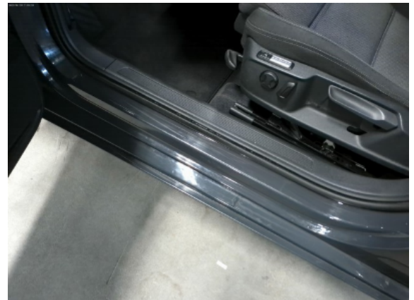
Abbildung 6: Siehe Pos.5