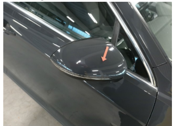
Abbildung 8: Siehe Pos.7