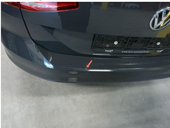
Abbildung 7: Siehe Pos.6