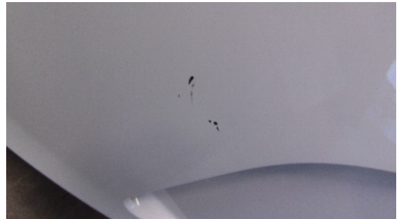
Abbildung 8: siehe pos.8