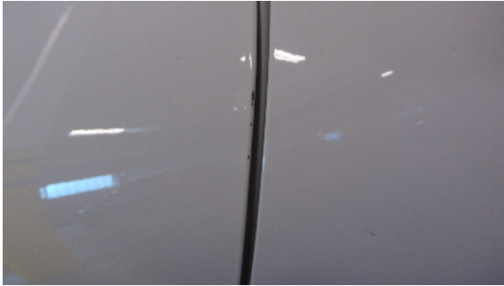
Abbildung 9: siehe pos.9