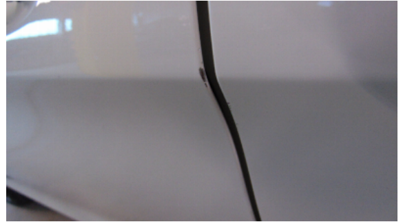
Abbildung 10: siehe pos.10