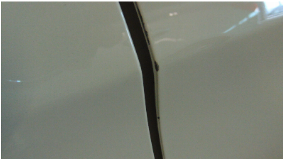
Abbildung 7: siehe pos.7