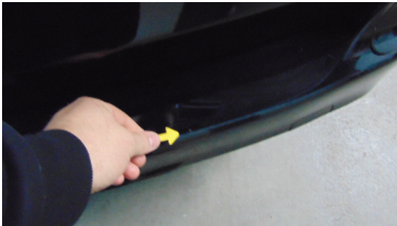
Abbildung 5: siehe pos.5