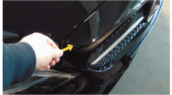
Abbildung 4: siehe pos.4