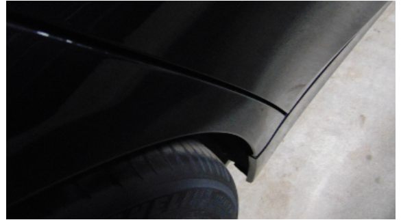
Abbildung 6: siehe pos.6