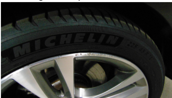
Abbildung 9: siehe pos.9