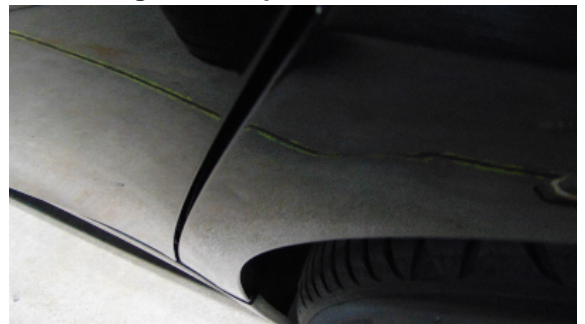
Abbildung 8: siehe pos.8