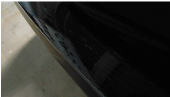
Abbildung 7: siehe pos.7