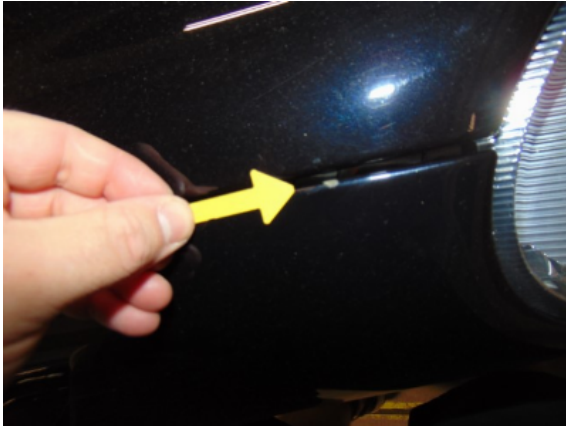
Abbildung 3: 3