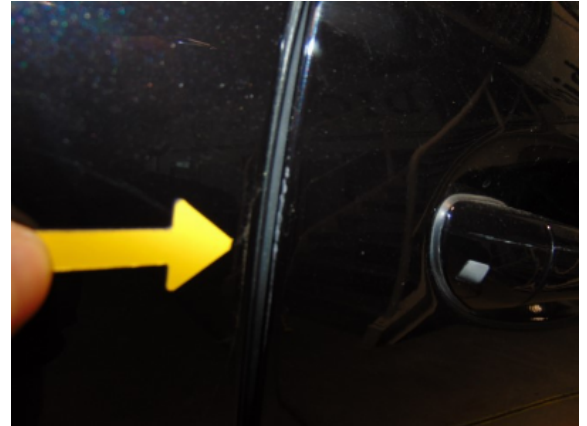
Abbildung 4: 4