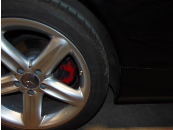
Abbildung 9: 9