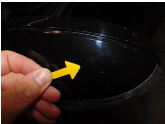
Abbildung 7: 7