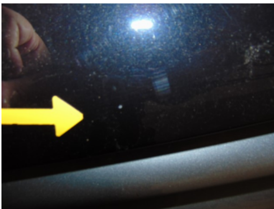
Abbildung 1: pos.1