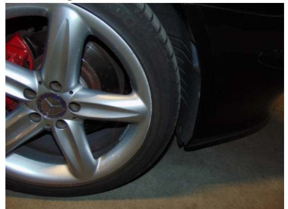
Abbildung 8: 8