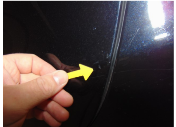
Abbildung 6: 6