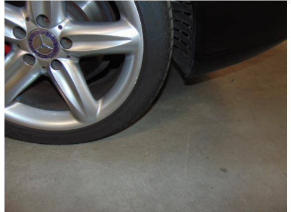
Abbildung 10: 10