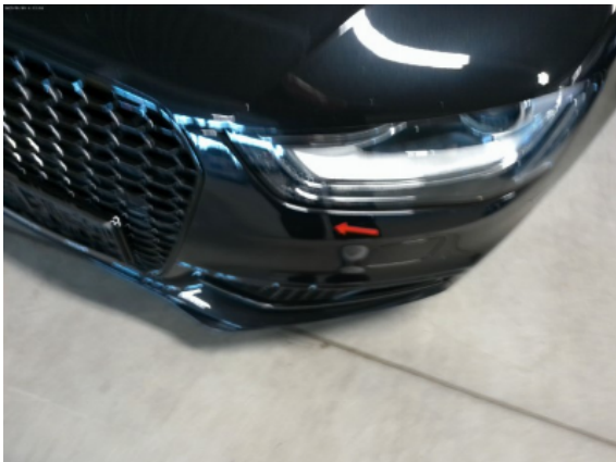
Abbildung 5: Siehe Pos.4