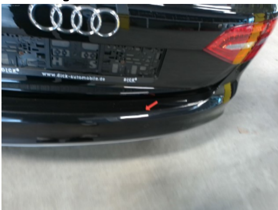
Abbildung 7: Siehe Pos.6