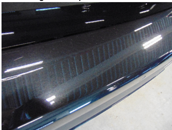
Abbildung 3: siehe pos.3