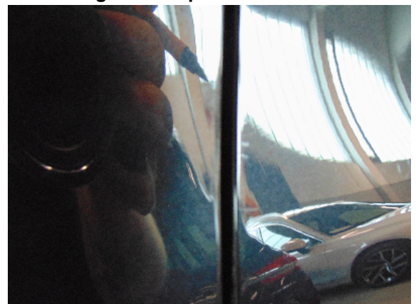
Abbildung 4: siehe pos.4