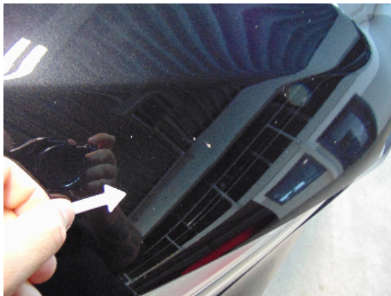
Abbildung 1: siehe pos.1