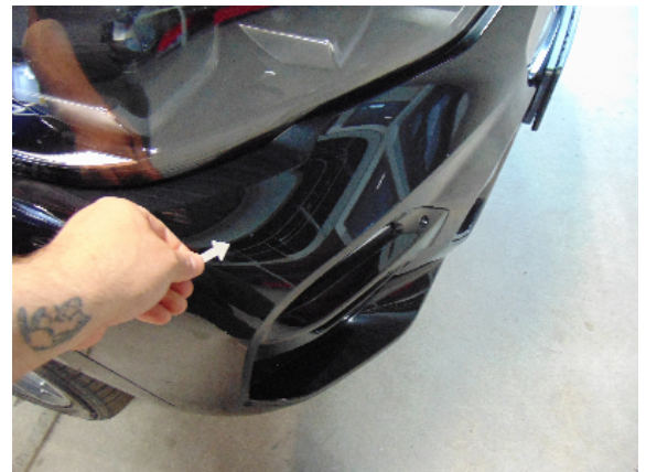
Abbildung 2: siehe pos.2