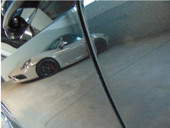
Abbildung 5: siehe pos.5