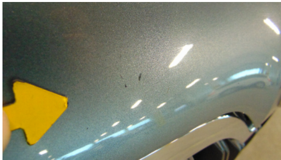
Abbildung 1: siehe pos.2