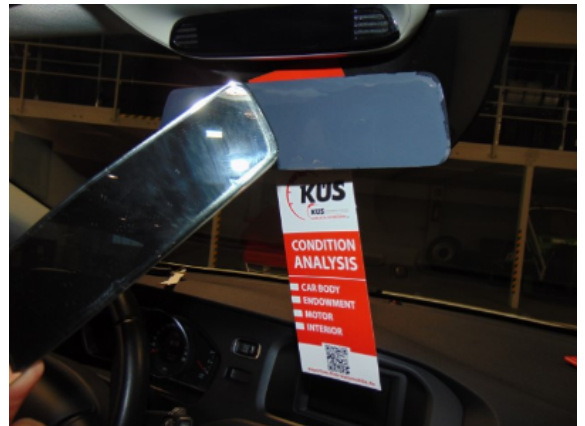
Abbildung 8: Siehe Pos.8