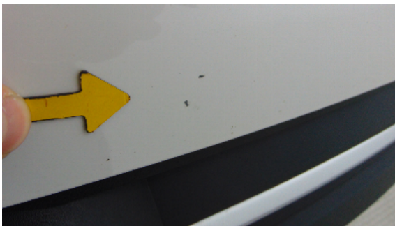
Abbildung 1: siehe pos.1