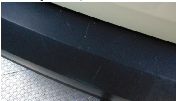
Abbildung 3: siehe pos.3