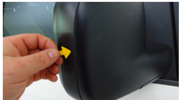
Abbildung 2: siehe pos.2