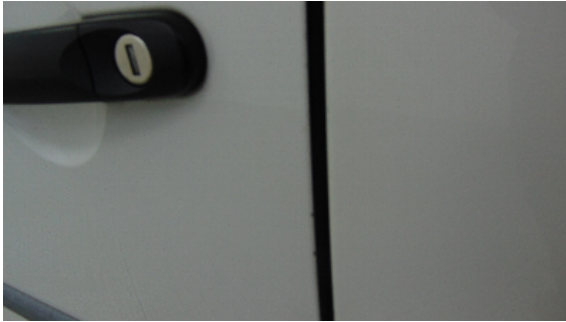
Abbildung 5: siehe pos.5