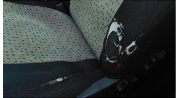
Abbildung 6: siehe pos.6