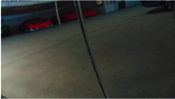
Abbildung 5: siehe pos.5