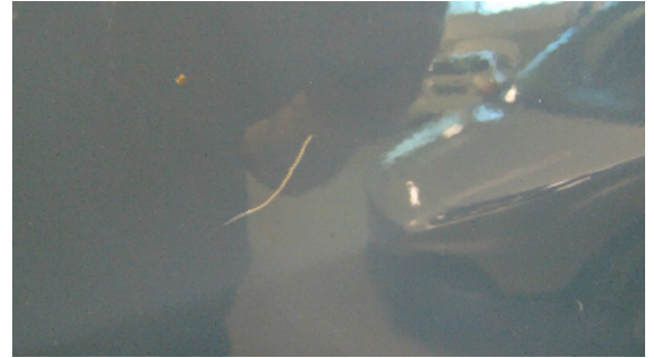
Abbildung 10: siehe pos.10