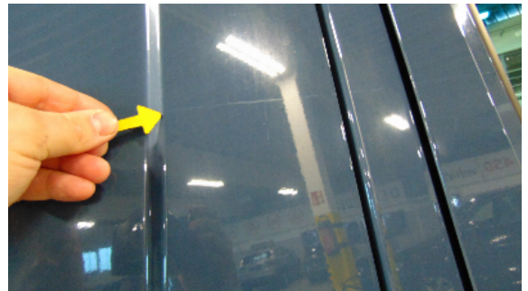
Abbildung 4: siehe pos.4