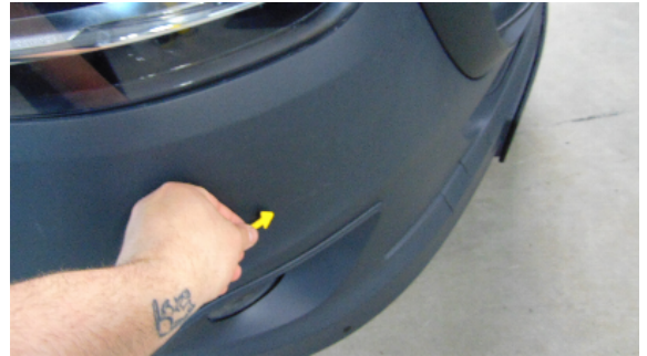
Abbildung 2: siehe pos.2