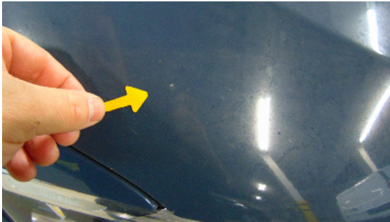
Abbildung 1: siehe pos.1