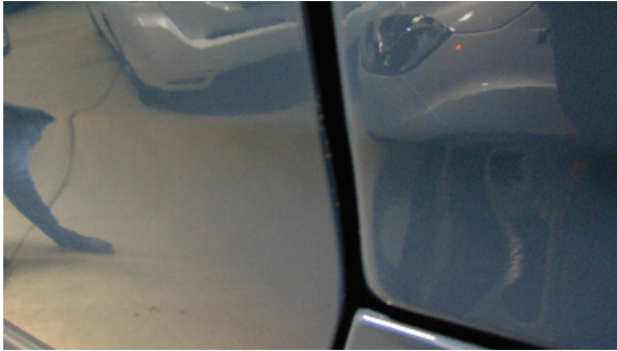
Abbildung 9: siehe pos.9