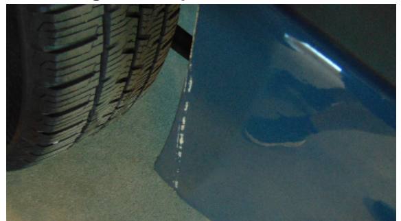
Abbildung 8: siehe pos.8