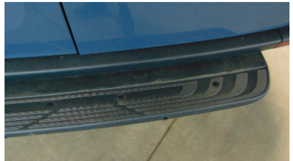
Abbildung 6: siehe pos.6