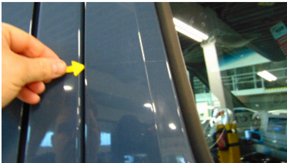
Abbildung 3: siehe pos.3