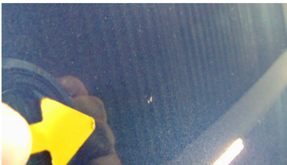
Abbildung 1: siehe pos.1