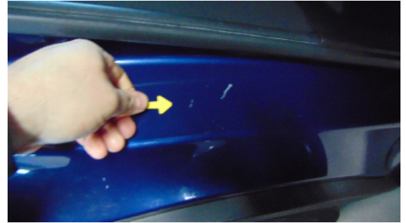
Abbildung 4: siehe pos.4