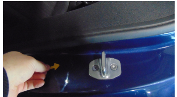
Abbildung 8: siehe pos.8