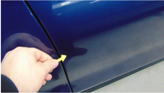
Abbildung 3: siehe pos.3