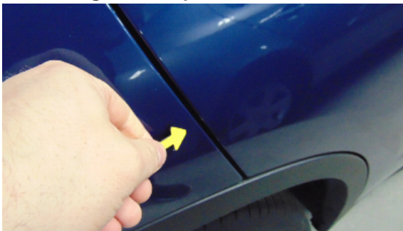
Abbildung 5: siehe pos.5