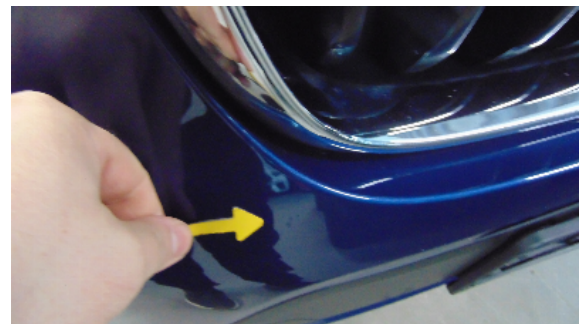
Abbildung 2: siehe pos.2