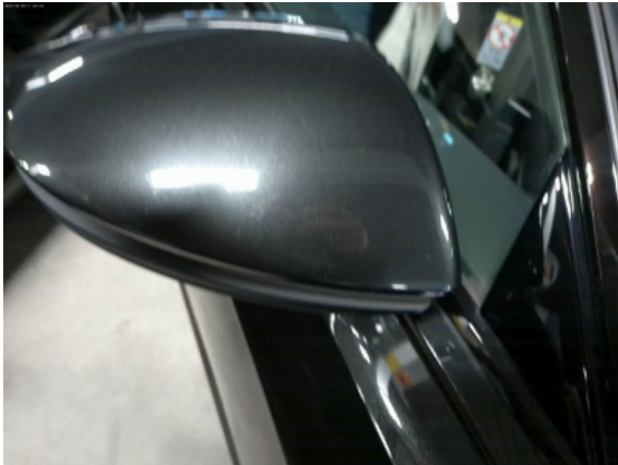
Abbildung 7: Siehe Pos.6