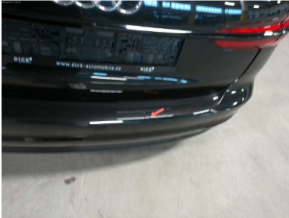
Abbildung 5: Siehe Pos.4