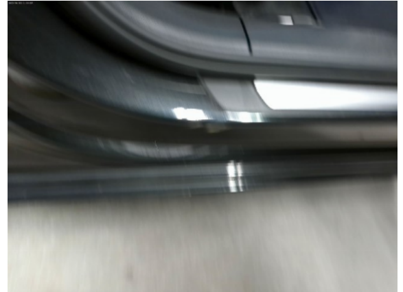
Abbildung 6: Siehe Pos.5