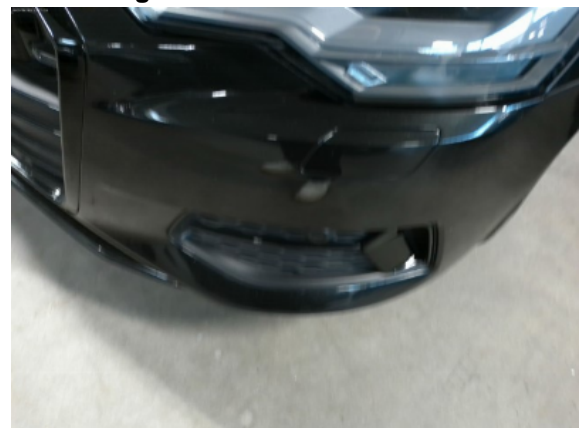
Abbildung 4: Siehe Pos.3