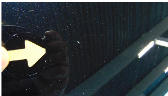
Abbildung 1: siehe pos.1