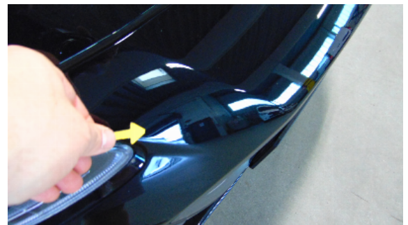
Abbildung 2: siehe pos.2