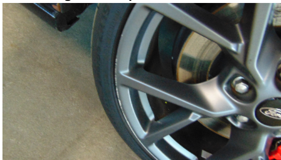
Abbildung 3: siehe pos.3