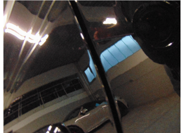
Abbildung 4: siehe pos.4