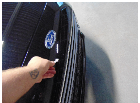
Abbildung 2: siehe pos.2