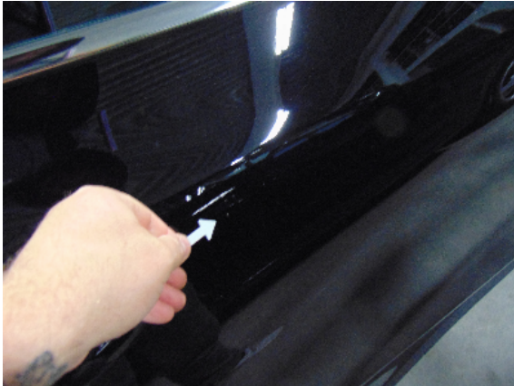
Abbildung 3: siehe pos.3