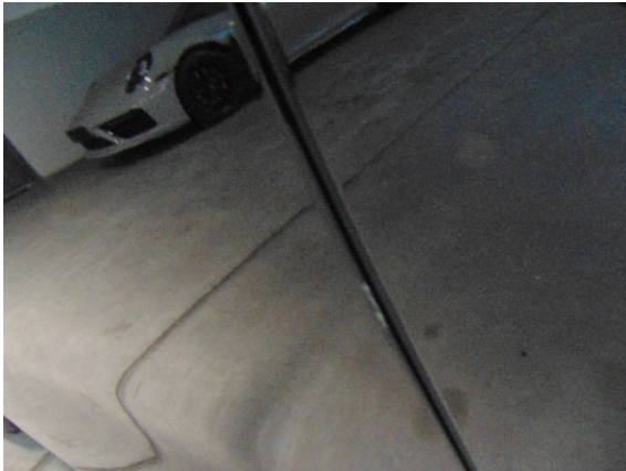
Abbildung 5: siehe pos.5