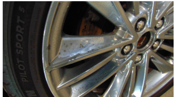
Abbildung 8: siehe pos.8