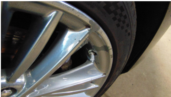
Abbildung 7: siehe pos.7