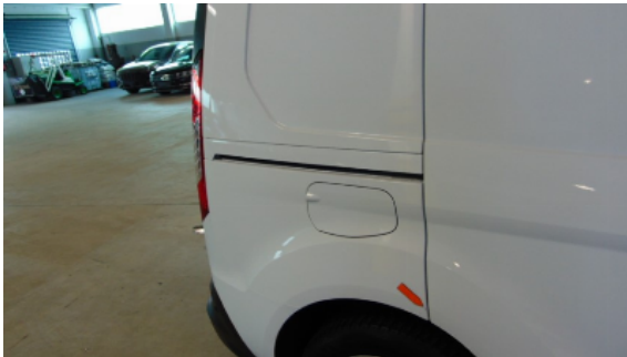
Abbildung 7: Siehe Pos.7