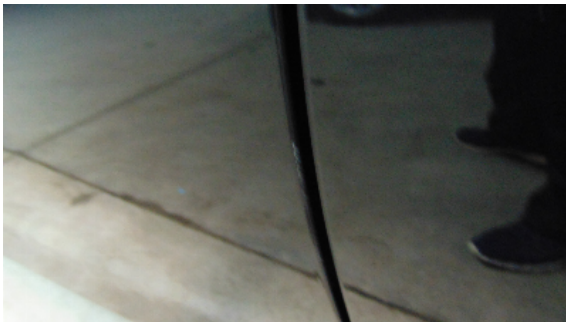
Abbildung 7: siehe pos.7