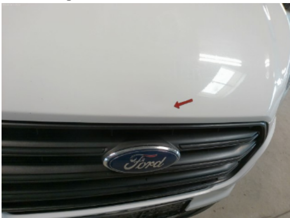
Abbildung 9: Siehe Pos.9