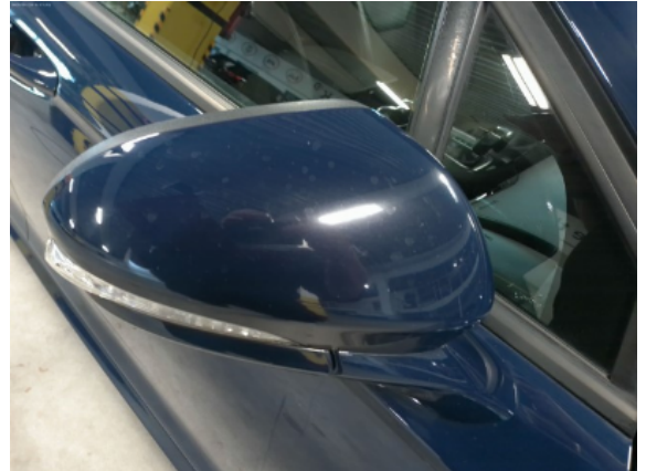
Abbildung 10: Siehe Pos.10