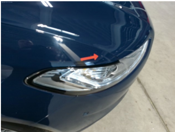
Abbildung 11: Siehe Pos.11