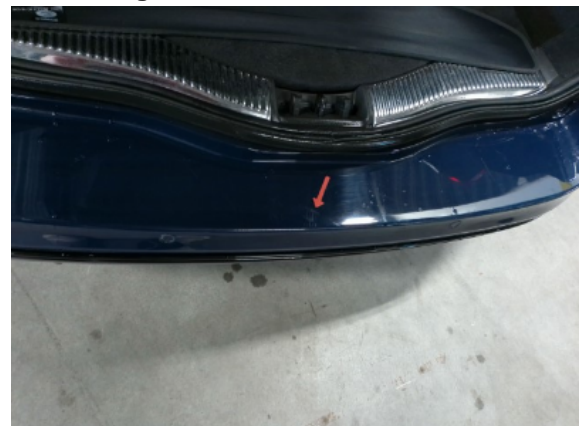
Abbildung 8: Siehe Pos.8