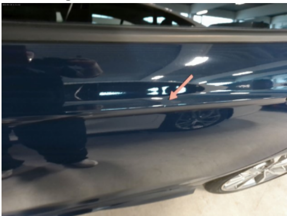
Abbildung 7: Siehe Pos.7