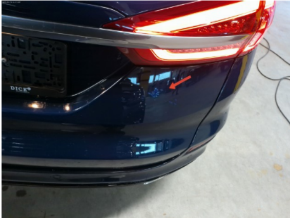
Abbildung 9: Siehe Pos.9