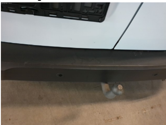
Abbildung 9: Siehe Pos.8