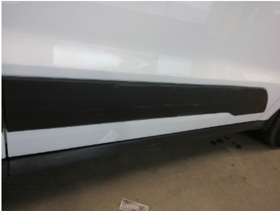
Abbildung 13: Siehe Pos.12