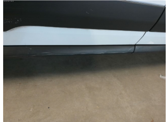
Abbildung 12: Siehe Pos.11