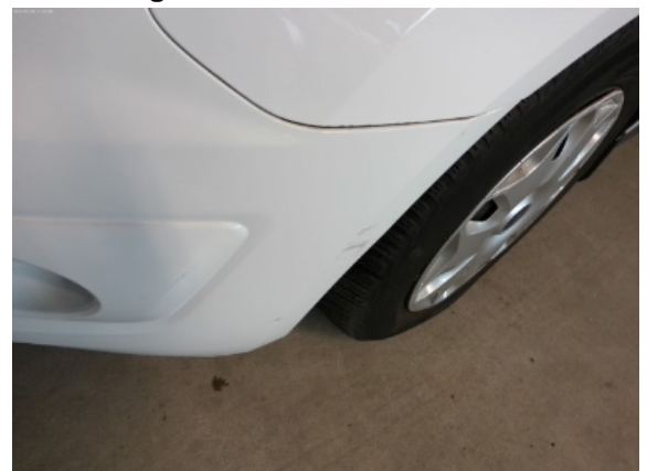
Abbildung 4: Siehe Pos.3