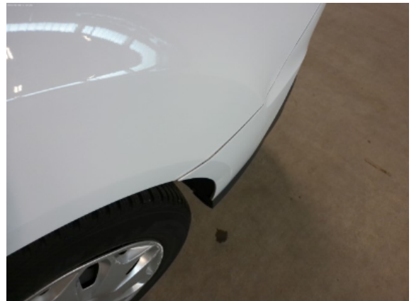
Abbildung 8: Siehe Pos.7