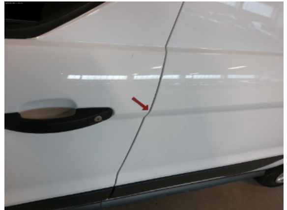
Abbildung 6: Siehe Pos.5