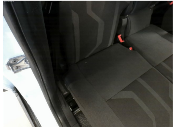
Abbildung 14: Siehe Pos.13