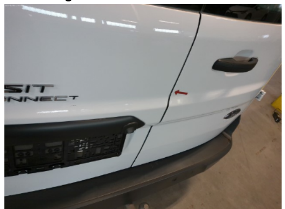
Abbildung 10: Siehe Pos.9