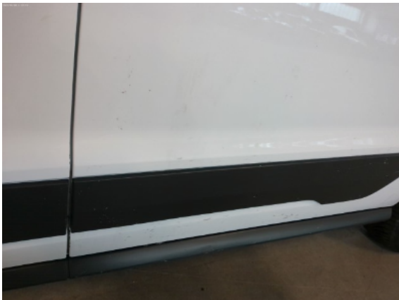
Abbildung 7: Siehe Pos.6