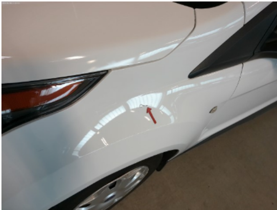
Abbildung 5: Siehe Pos.4