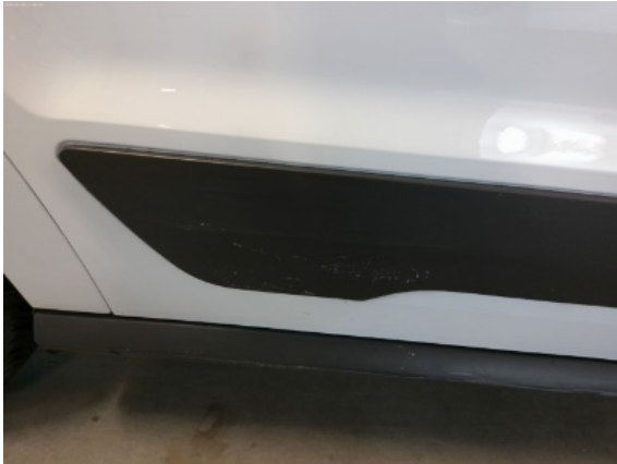
Abbildung 11: Siehe Pos.10