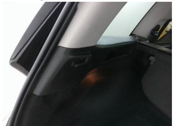
Abbildung 8: Siehe Pos.6