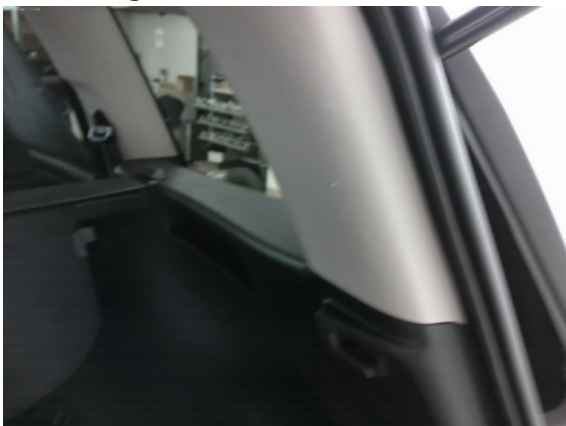
Abbildung 7: Siehe Pos.6