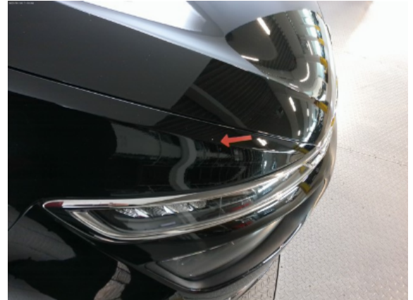
Abbildung 10: Siehe Pos.8