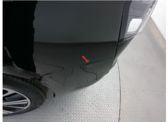
Abbildung 4: Siehe Pos.3