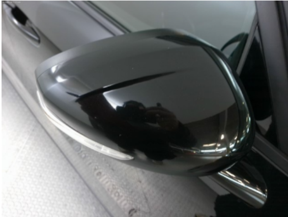
Abbildung 9: Siehe Pos.7