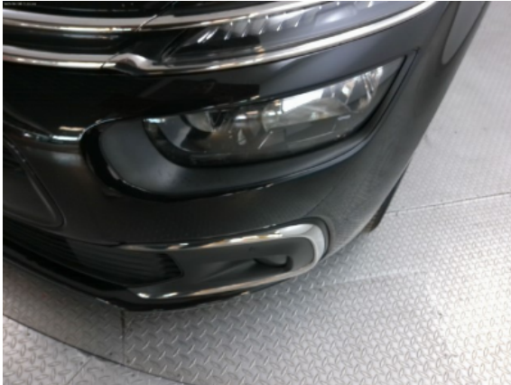
Abbildung 3: Siehe Pos.2