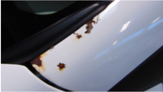
Abbildung 9: siehe pos.9