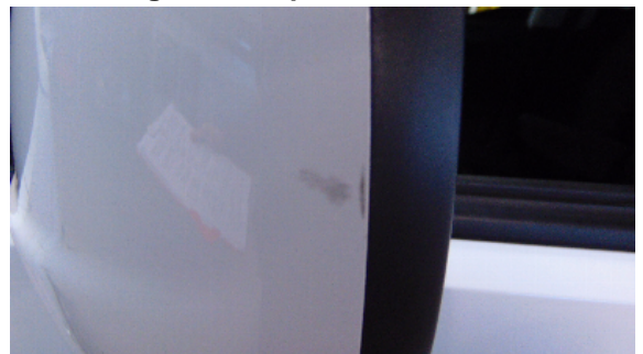
Abbildung 8: siehe pos.8