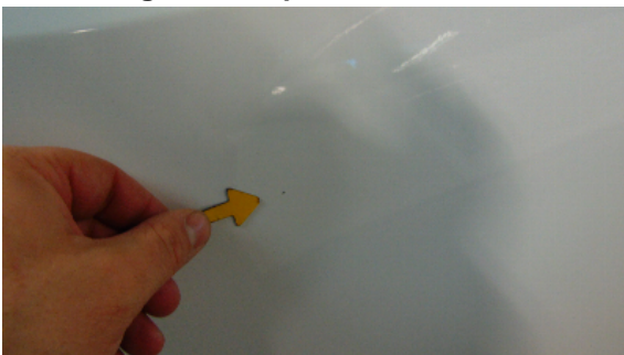
Abbildung 7: siehe pos.7