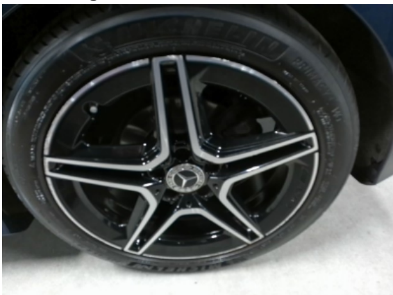
Abbildung 11: Siehe Pos.10