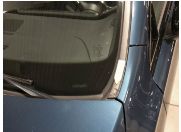
Abbildung 8: Siehe Pos.7