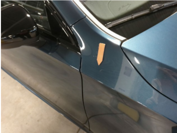
Abbildung 13: Siehe Pos.12