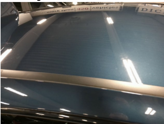
Abbildung 5: Siehe Pos.4