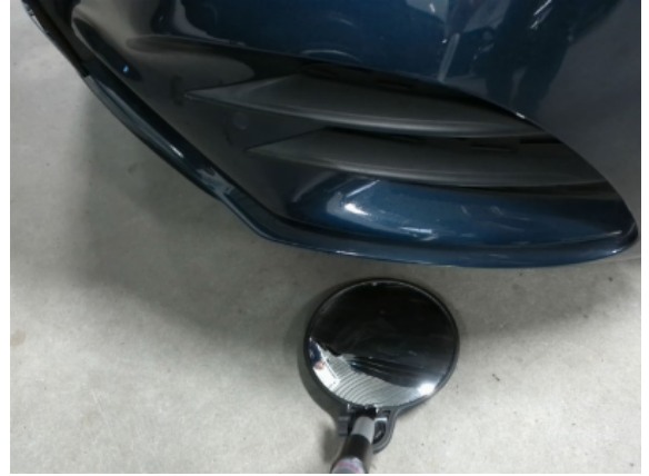
Abbildung 2: Siehe Pos.1