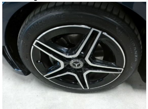
Abbildung 6: Siehe Pos.5