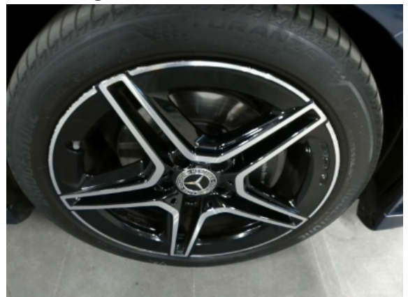
Abbildung 12: Siehe Pos.11