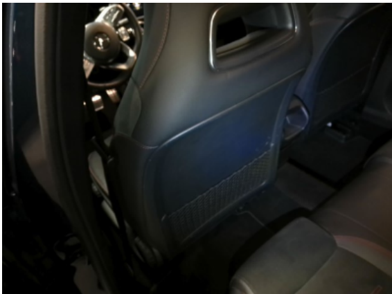
Abbildung 9: Siehe Pos.8