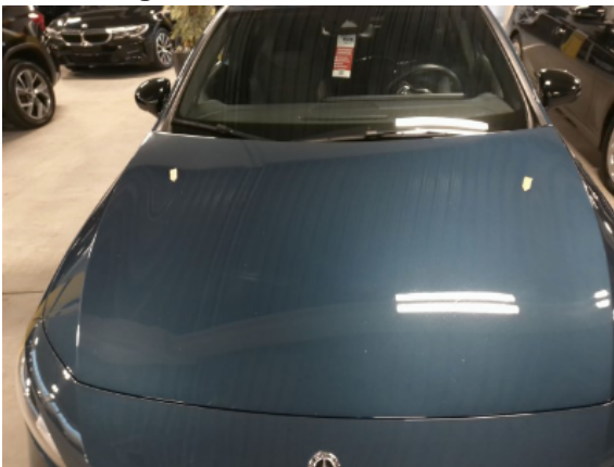
Abbildung 3: Siehe Pos.2