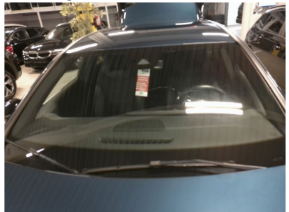
Abbildung 4: Siehe Pos.3