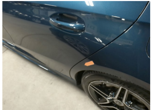
Abbildung 10: Siehe Pos.9