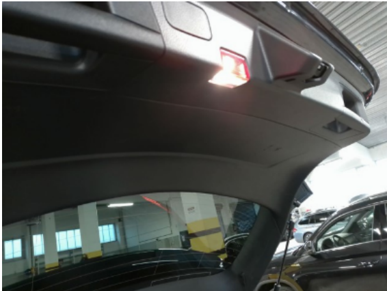
Abbildung 15: Siehe Pos.14