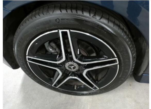
Abbildung 14: Siehe Pos.13