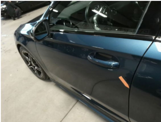
Abbildung 7: Siehe Pos.6