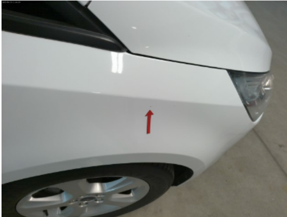
Abbildung 9: Siehe Pos.9