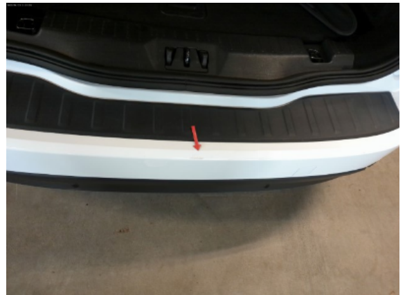
Abbildung 8: Siehe Pos.8