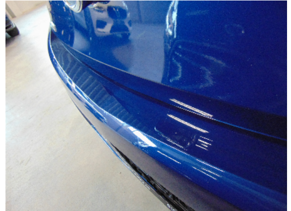
Abbildung 4: siehe pos.4