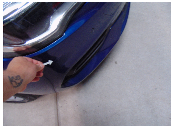
Abbildung 2: siehe pos.2