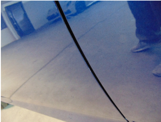
Abbildung 5: siehe pos.5