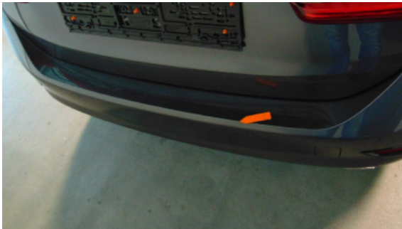
Abbildung 7: Siehe Pos.6