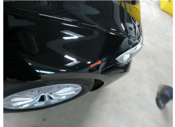
Abbildung 10: Siehe Pos.9