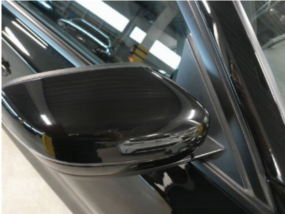
Abbildung 9: Siehe Pos.8