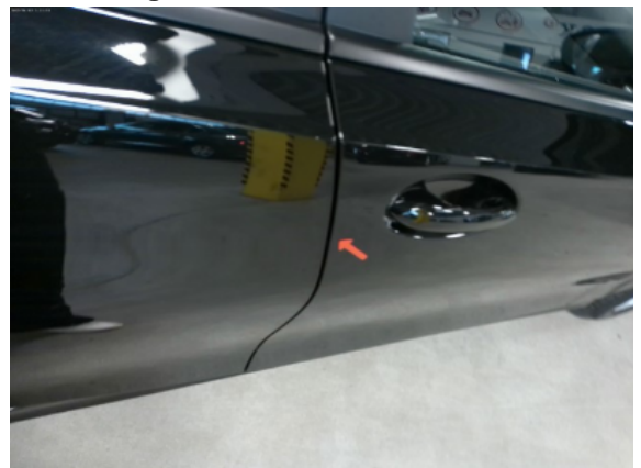
Abbildung 8: Siehe Pos.7