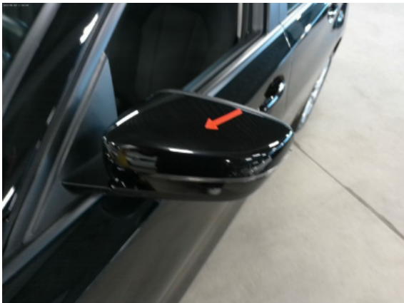
Abbildung 5: Siehe Pos.4