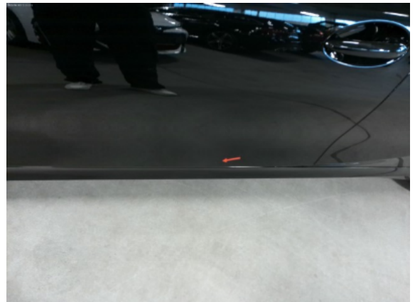
Abbildung 6: Siehe Pos.5