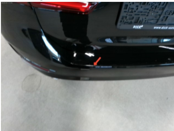
Abbildung 7: Siehe Pos.6