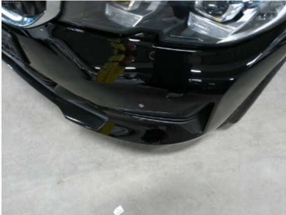
Abbildung 3: Siehe Pos.2