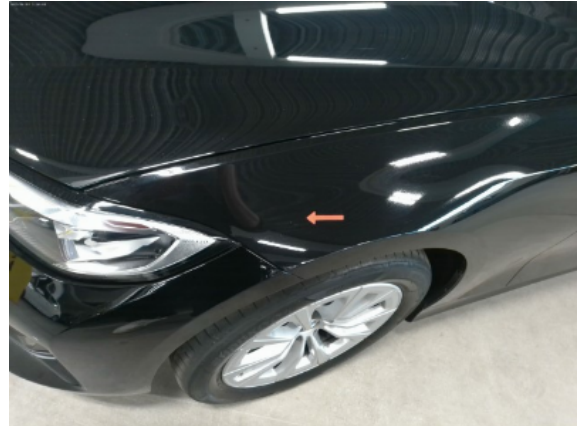
Abbildung 4: Siehe Pos.3