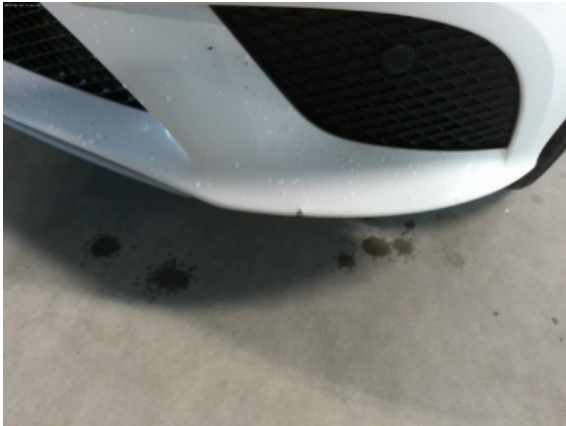
Abbildung 5: Siehe Pos.4