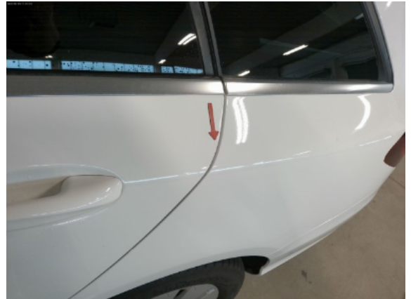
Abbildung 6: Siehe Pos.5