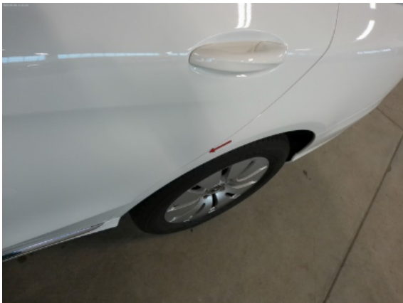
Abbildung 7: Siehe Pos.6