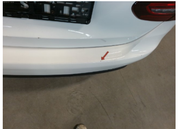
Abbildung 8: Siehe Pos.7