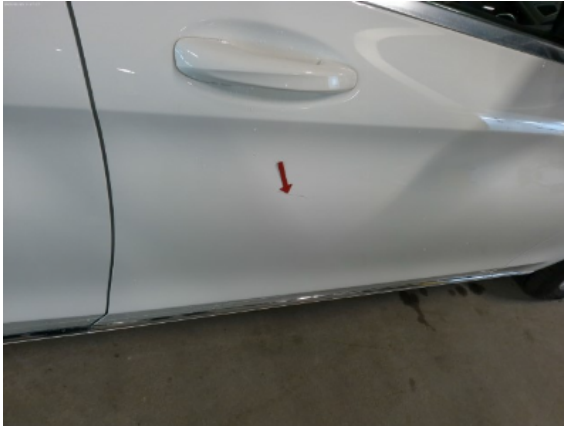
Abbildung 9: Siehe Pos.8