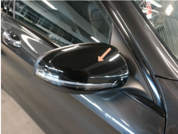
Abbildung 9: Siehe Pos.8