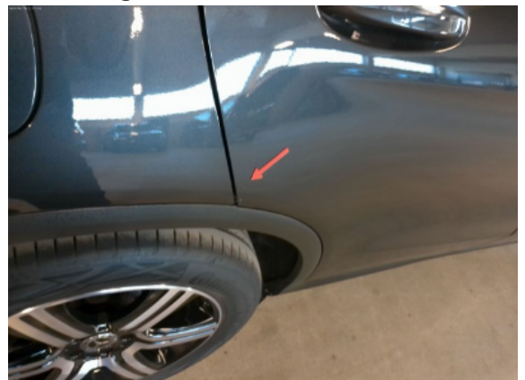
Abbildung 8: Siehe Pos.