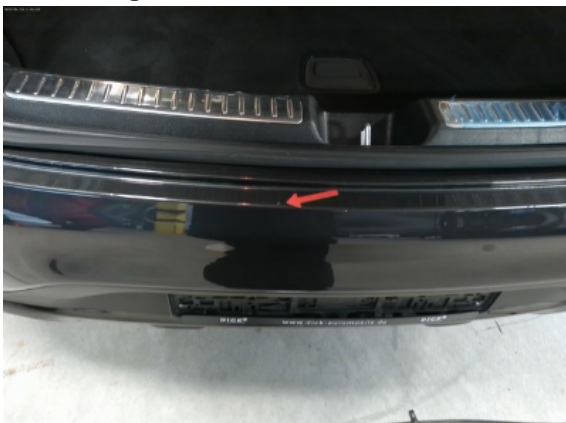
Abbildung 7: Siehe Pos.6