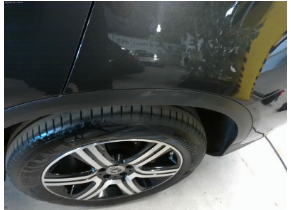
Abbildung 6: Siehe Pos.5