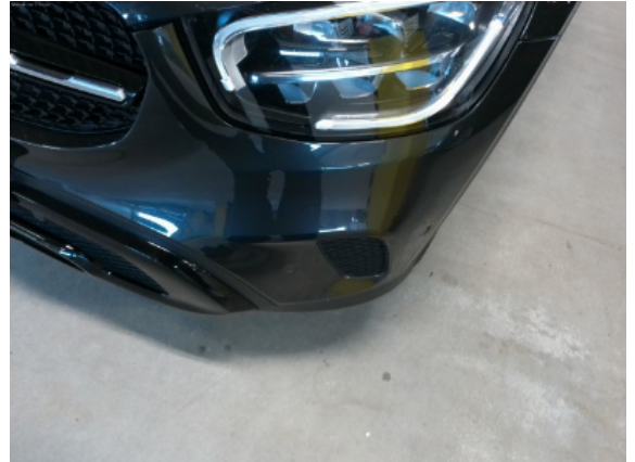
Abbildung 4: Siehe Pos.3