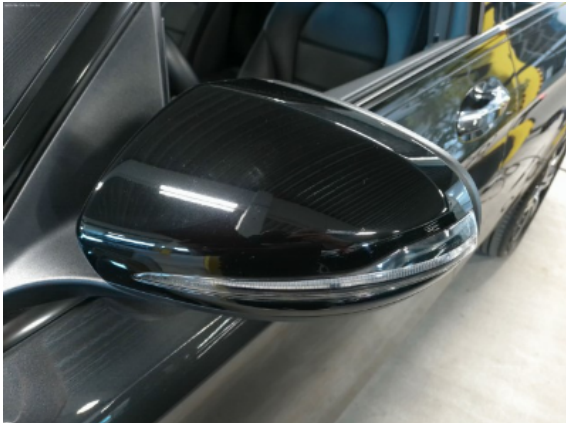
Abbildung 5: Siehe Pos.4