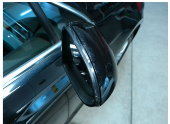
Abbildung 8: Siehe Pos.6