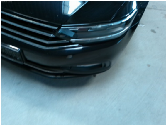
Abbildung 3: Siehe Pos.2