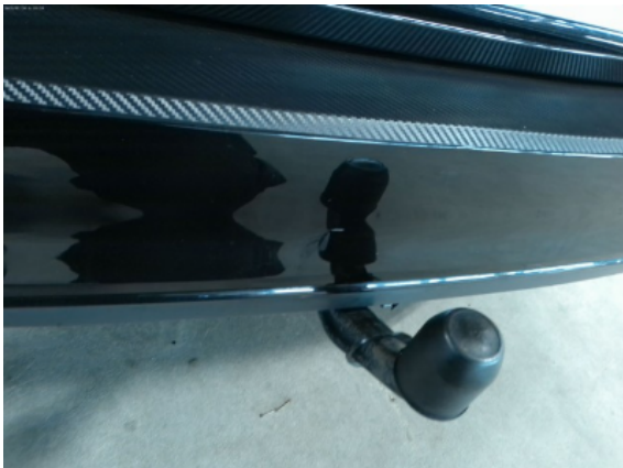
Abbildung 5: Siehe Pos.4