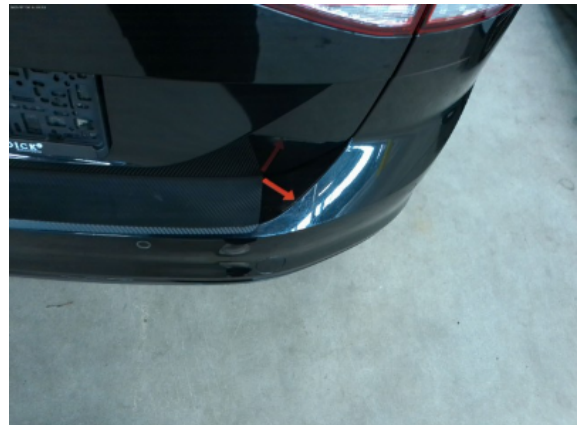
Abbildung 6: Siehe Pos.4