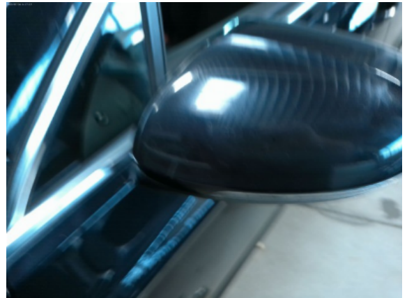
Abbildung 4: Siehe Pos.3