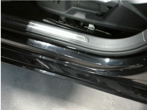
Abbildung 5: Siehe Pos.4