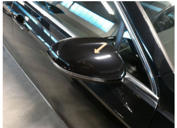
Abbildung 8: Siehe Pos.7