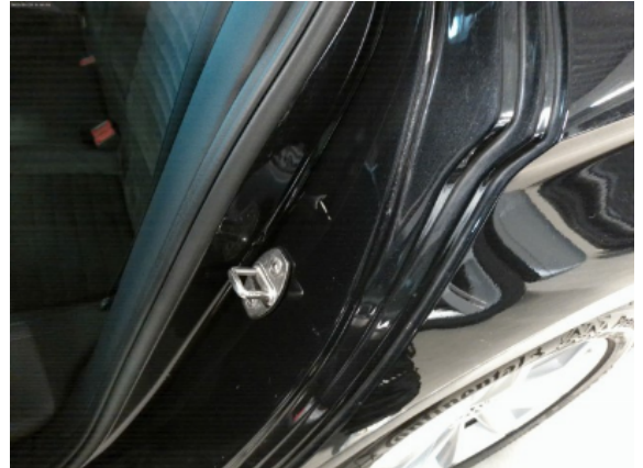
Abbildung 6: Siehe Pos.5