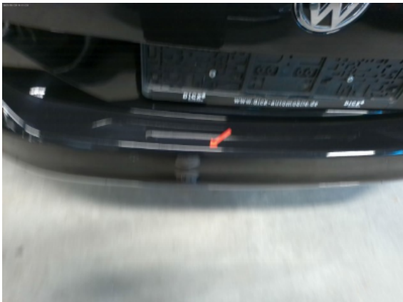
Abbildung 7: Siehe Pos.6