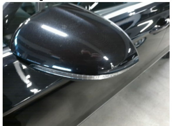
Abbildung 4: Siehe Pos.3