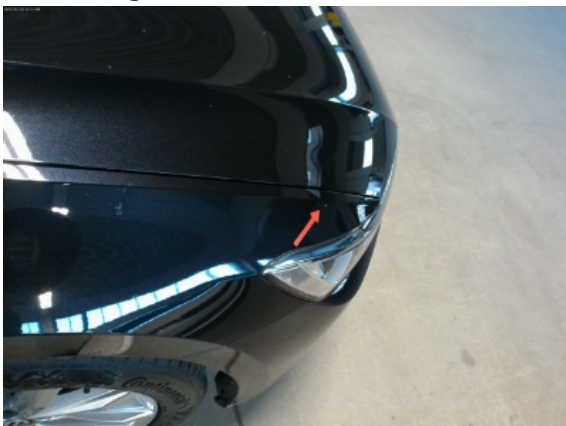
Abbildung 9: Siehe Pos.8