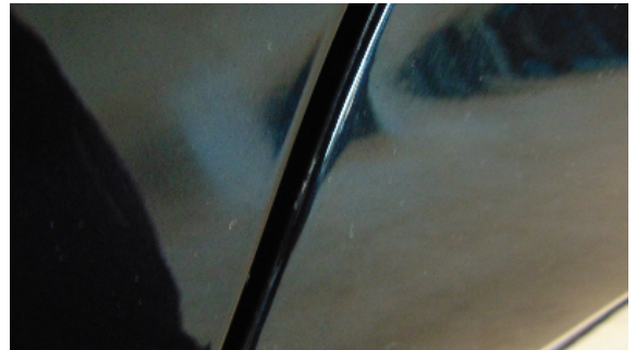
Abbildung 6: siehe pos.6