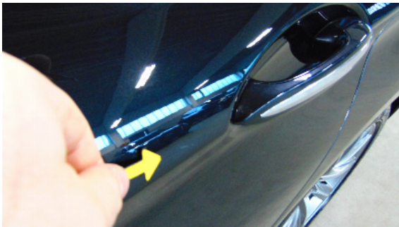
Abbildung 7: siehe pos.7