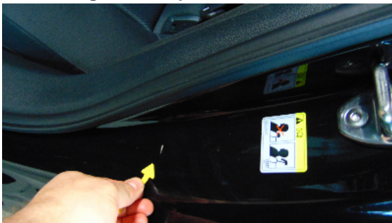
Abbildung 7: siehe pos.7