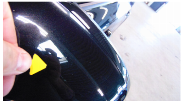
Abbildung 8: siehe pos.8