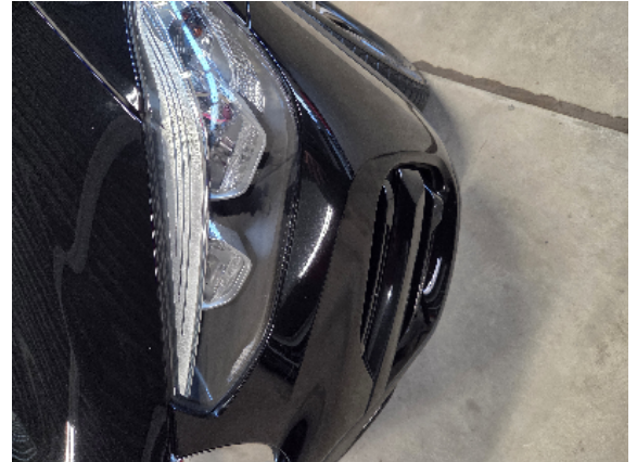
Abbildung 4: Siehe Pos.3