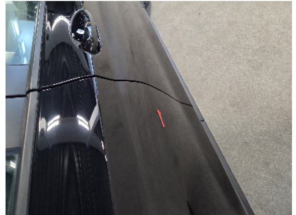
Abbildung 6: Siehe Pos.5