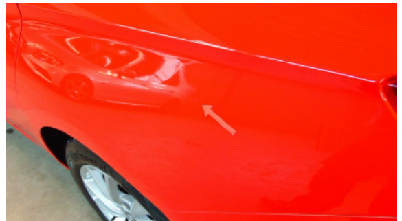
Abbildung 8: Siehe Pos.8