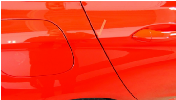
Abbildung 9: Siehe Pos.9