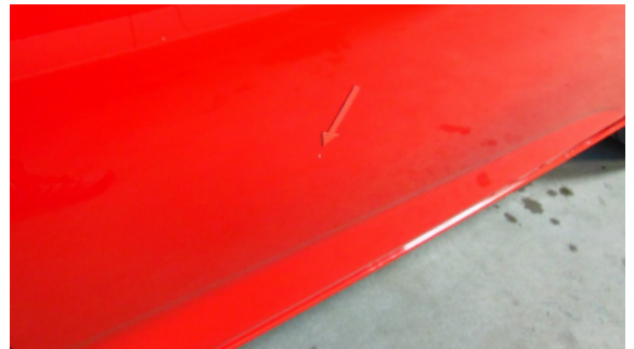
Abbildung 10: Siehe Pos.10