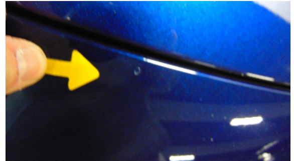
Abbildung 2: siehe pos.2