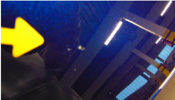
Abbildung 1: siehe pos.1