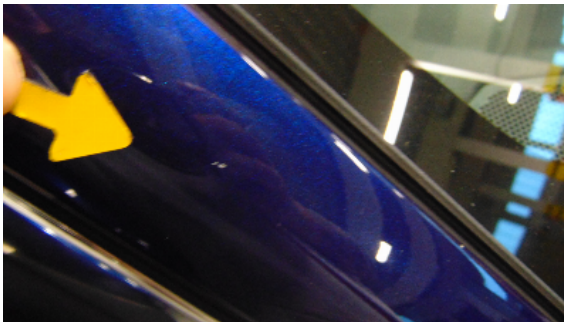
Abbildung 3: siehe pos.3