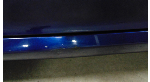
Abbildung 6: siehe pos.6