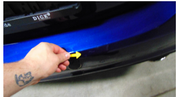
Abbildung 4: siehe pos.4