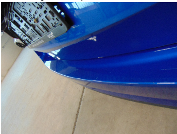
Abbildung 3: siehe pos.3