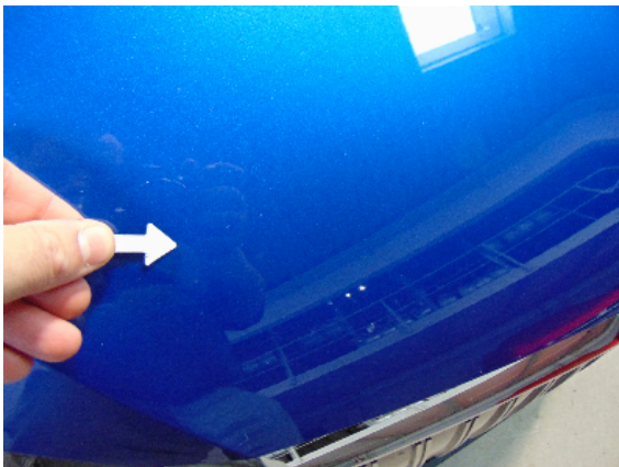
Abbildung 1: siehe pos.1