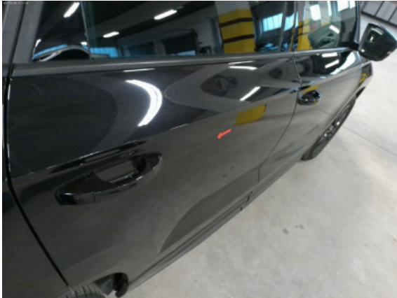
Abbildung 9: Siehe Pos.8