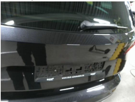
Abbildung 7: Siehe Pos.6