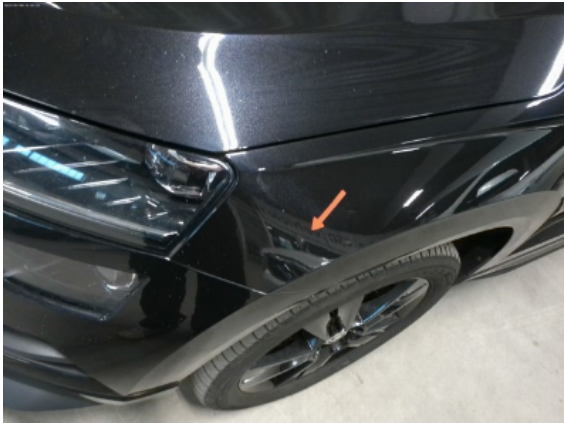
Abbildung 5: Siehe Pos.4