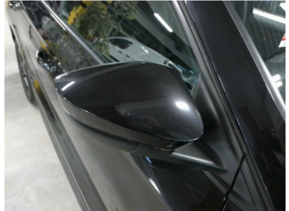
Abbildung 10: Siehe Pos.9