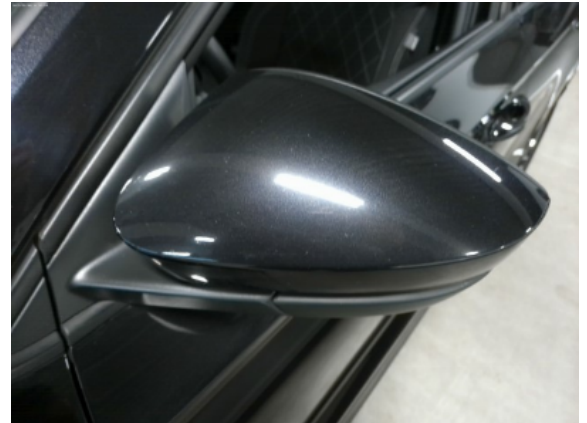
Abbildung 6: Siehe Pos.5