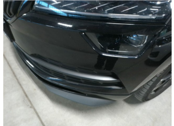
Abbildung 4: Siehe Pos.3