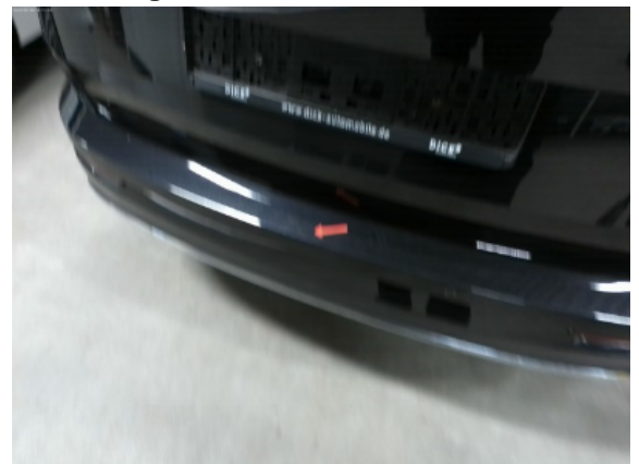
Abbildung 8: Siehe Pos.7