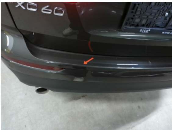
Abbildung 7: Siehe Pos.6