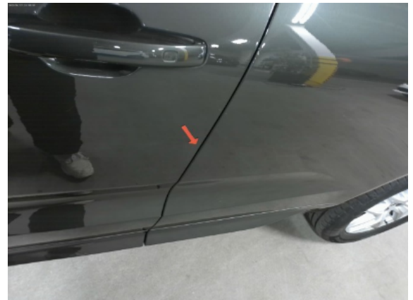
Abbildung 6: Siehe Pos.5