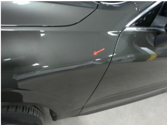
Abbildung 5: Siehe Pos.4