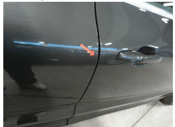
Abbildung 8: Siehe Pos.7