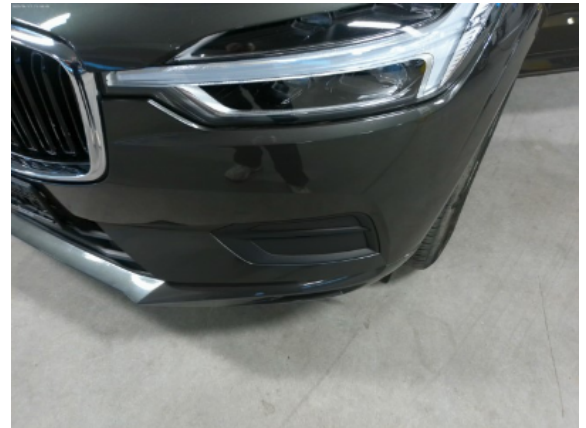
Abbildung 4: Siehe Pos.3