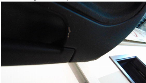
Abbildung 3: siehe pos.3