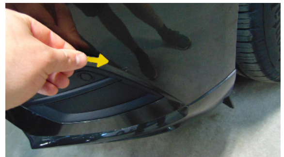
Abbildung 2: siehe pos.2