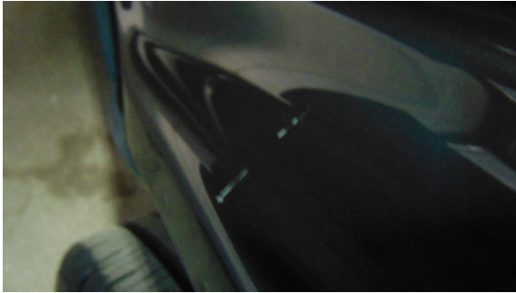
Abbildung 5: siehe pos.5