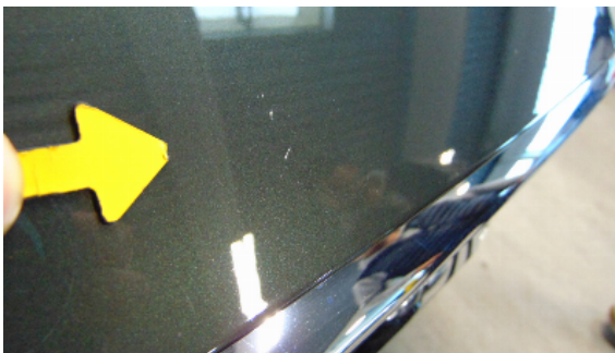
Abbildung 1: siehe pos.1