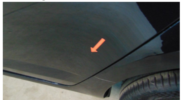
Abbildung 8: Siehe Pos.7