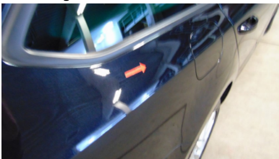
Abbildung 13: Siehe Pos.11