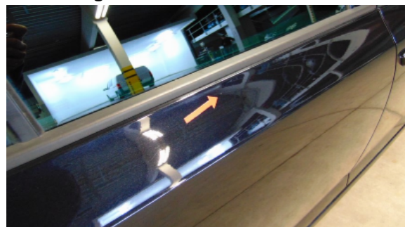
Abbildung 14: Siehe Pos.12