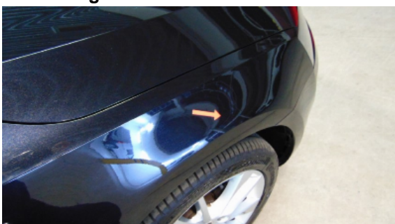
Abbildung 15: Siehe Pos.13