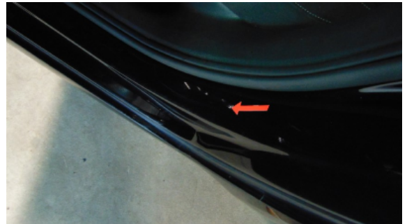
Abbildung 10: Siehe Pos.8