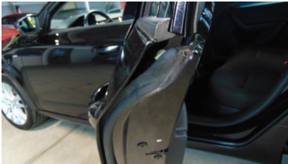
Abbildung 9: Siehe Pos.7