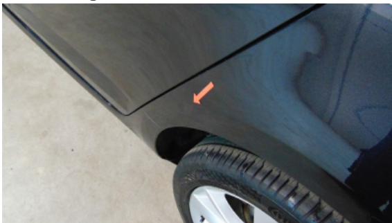
Abbildung 11: Siehe Pos.9