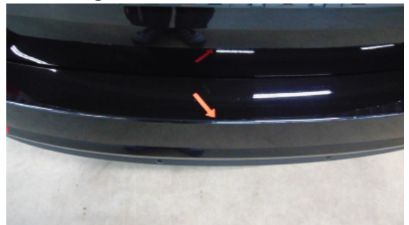
Abbildung 12: Siehe Pos.10