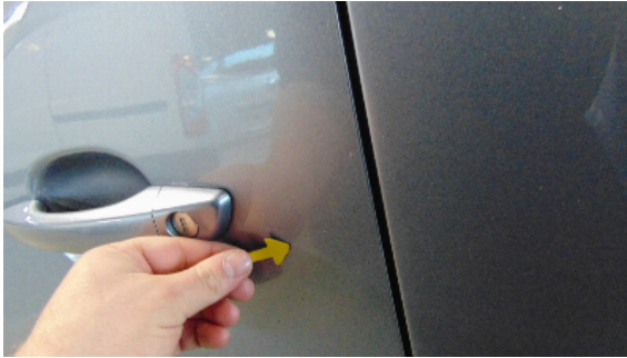
Abbildung 5: siehe pos.5