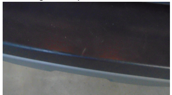
Abbildung 4: siehe pos.4