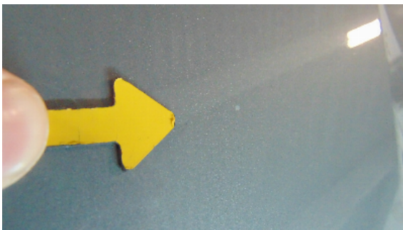
Abbildung 1: siehe pos.1