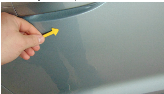
Abbildung 3: siehe pos.3