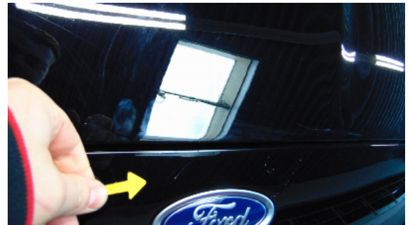
Abbildung 2: siehe pos.2