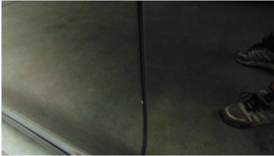
Abbildung 5: siehe pos.5