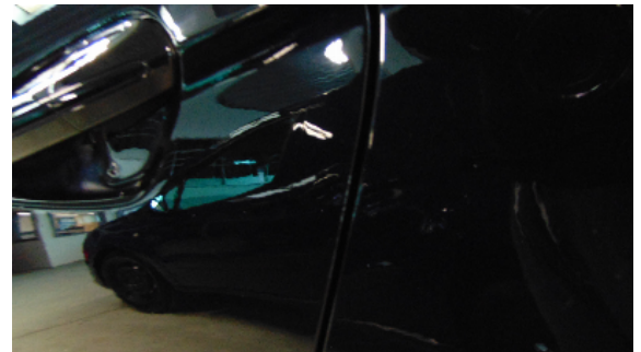
Abbildung 4: siehe pos.4