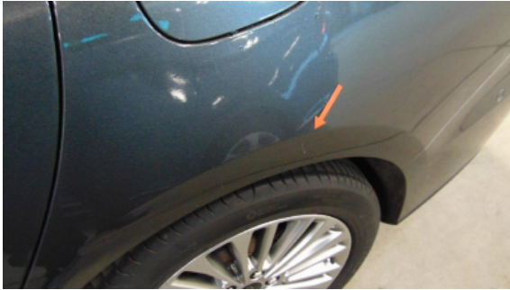
Abbildung 9: Siehe Pos.9