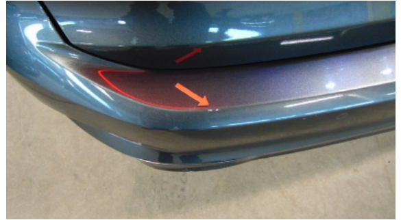
Abbildung 10: Siehe Pos.10