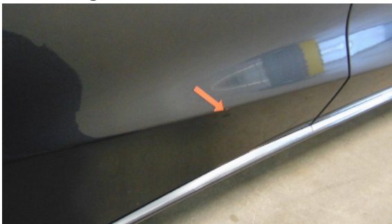
Abbildung 11: Siehe Pos.11