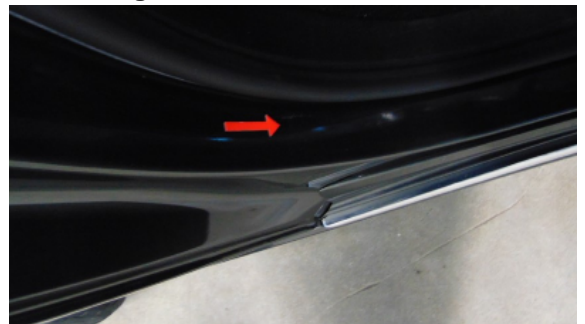
Abbildung 12: Siehe Pos.12