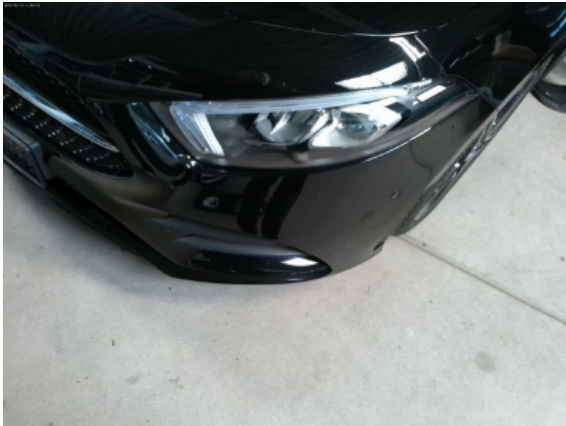
Abbildung 5: Siehe Pos.4