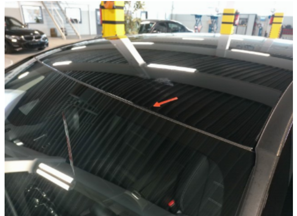
Abbildung 6: Siehe Pos.5