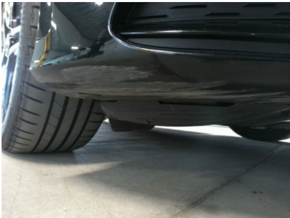
Abbildung 11: Siehe Pos.10