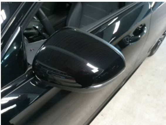
Abbildung 7: Siehe Pos.6