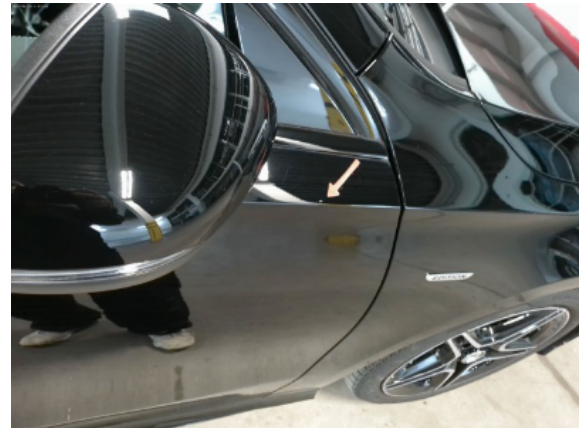
Abbildung 10: Siehe Pos.9