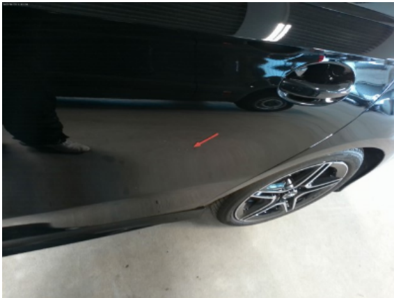
Abbildung 9: Siehe Pos.8